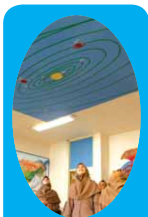
اتصال به عوامل بیرونی

وقتی دانش‌آموز مفهوم کسر را از طریق تقسیم خوراکی‌ها میان دوستانش دریافت می‌کند، عمق یادگیری افزایش می‌یابد